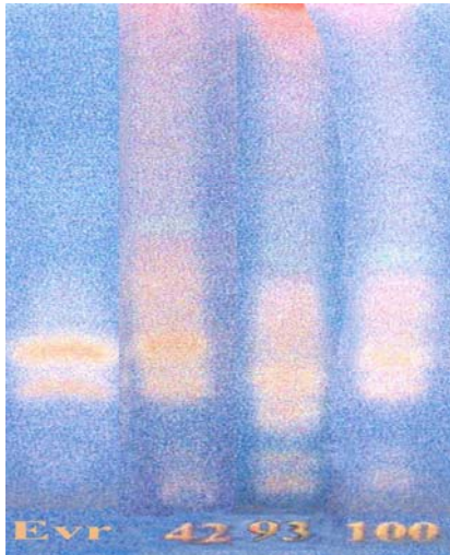
شکل ۳- کروماتوگرافی لایه نازک TLC

برای ساپونینهای خالص شده ۴ رقم یونجه با بوتانل اشباع از آب 100= رقم گوران طالقان، 93= رقم خورونده همدان، 42= رقم اهر، Evr= رقم شاهد اور