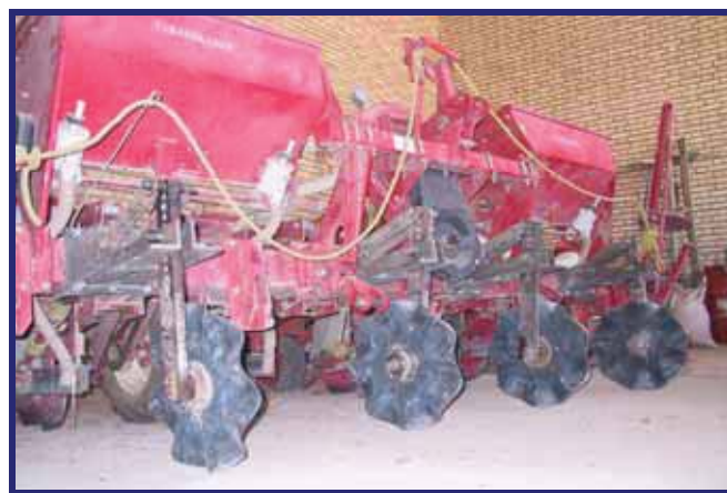
شکل ۳- نصب پیش‌برهای دیسکی مواج در جلو واحد های کاشت ردیف‌کارهای مرسوم