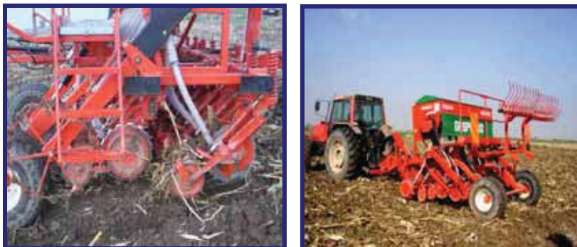
شکل ۱- ماشین کاشت مخصوص سیستم بی خاک‌ورزی برای غلات با شیار بازکن‌های دیسکی کنگره دار